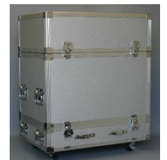
キャリングケース収納時